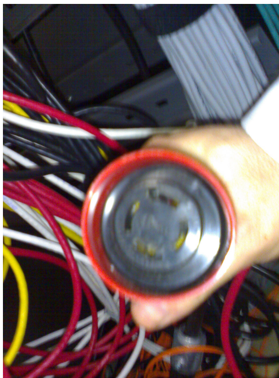
Figura 2. Modelo de tomada utilizado nos racks do datacenter